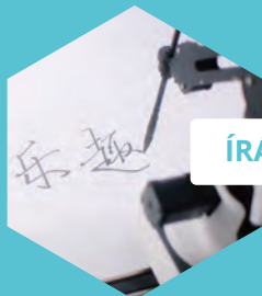
ÍRÁS ÉS RAJZOLÁS